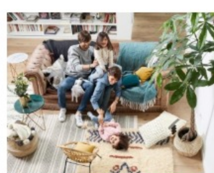
UNE DECO ANTI-DEPRIME 8 janvier 2018