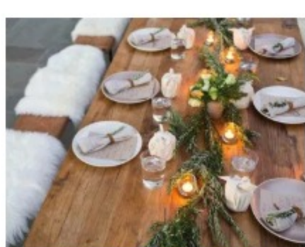
5 ASTUCES DECO POUR UN DINER COSY 11 novembre 2016