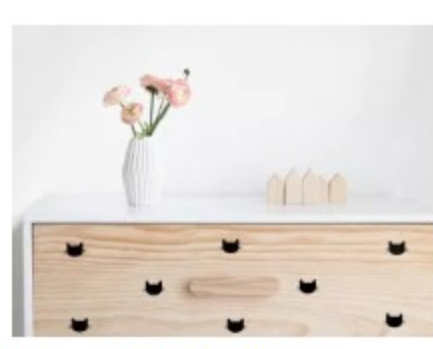
DIY - 3 MANIÈRES DE TWISTER UNE COMMODE POUR ENFANT